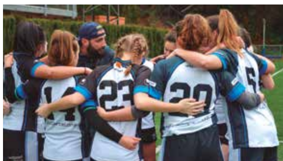
Equip oficial de rugbi femení. Campionats de Catalunya Universitaris