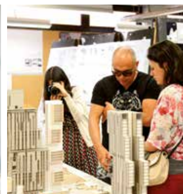
TFG guanyador del Premi Schindler Espanya 2018