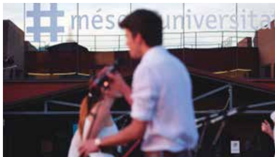
Concert del cor de gòspel. Festa de fi de curs

A UIC Barcelona promovem i organitzem activitats esportives i competicions, i facilitem descomptes i condicions avantatjoses per accedir a instal·lacions esportives perquè et mantinguis en forma i visquis de manera saludable. Durant el curs, organitzem activitats solidàries amb múltiples institucions i t'assessorem perquè facis voluntariat. Podràs participar de manera activa en el #UICSocialDay , un dia en el qual tota la Universitat es bolca a ajudar els més necessitats. També podràs formar part de grups de teatre, debat, pintura i música, que potencien el vessant cultural de UIC Barcelona i t'ajuden a adquirir més competències i valors.