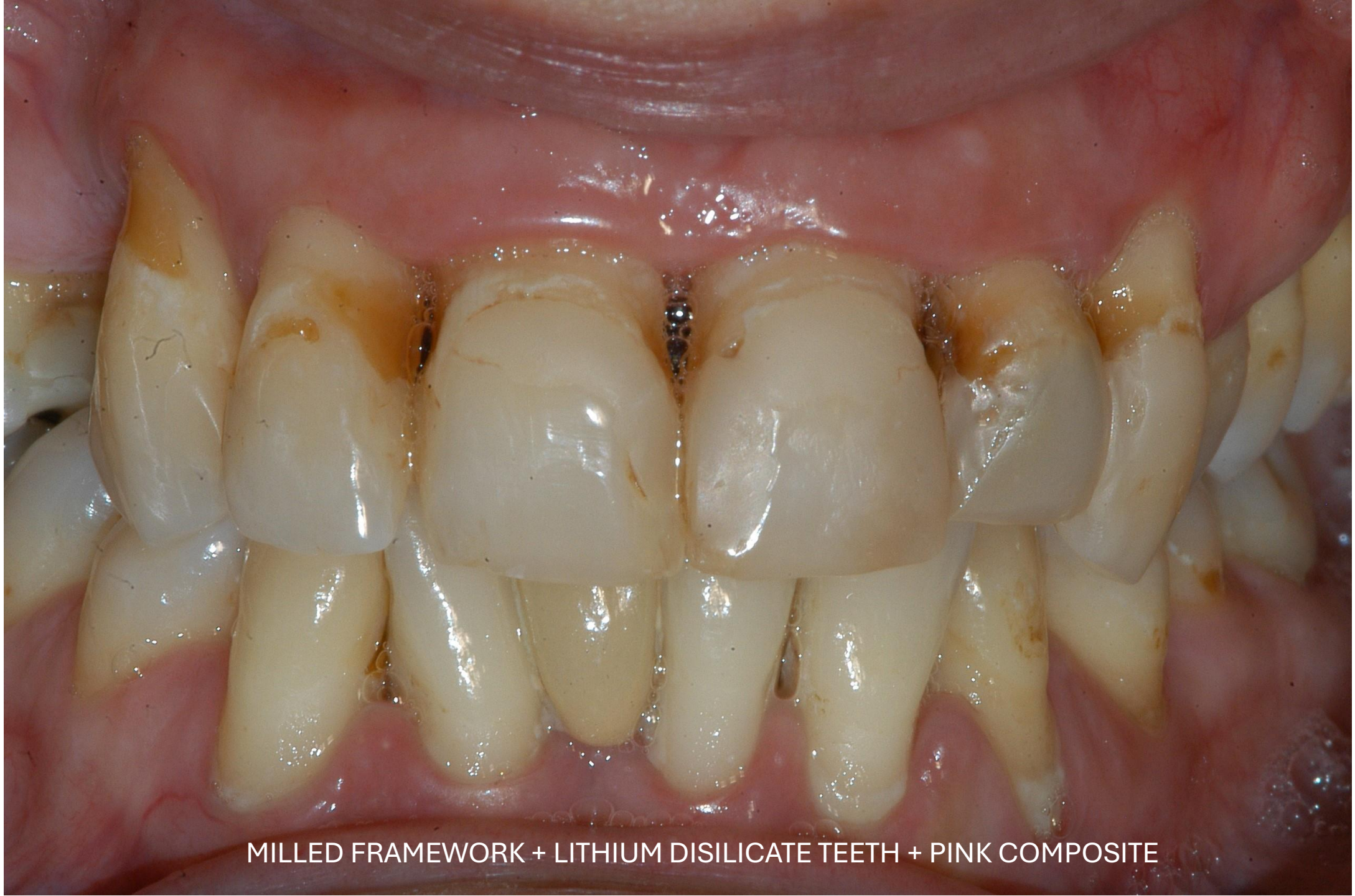
MILLED FRAMEWORK + LITHIUM DISILICATE TEETH + PINK COMPOSITE