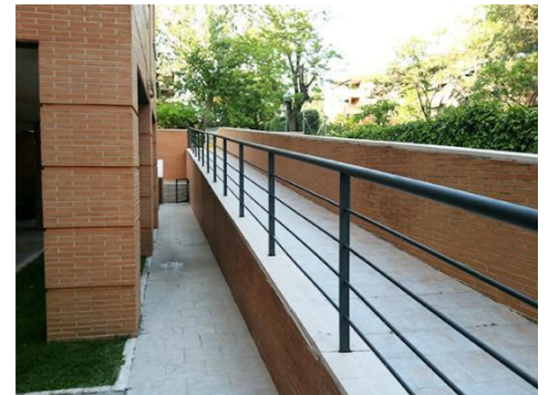
Figura 2 y 3. Rampa y pasarela Campus Barcelona

Cada piso de UIC Barcelona cuenta con un baño accesible para personas con diversidad funcional con un amplio espacio que facilita el ingreso al baño de una persona en silla de ruedas, si corresponde. El baño también cuenta con una barandilla metálica adosada a la pared que sirve de apoyo para que las personas con diversidad funcional puedan sentirse autosuficientes para ir al baño por sus propios medios ya que cuentan con la seguridad de un soporte.